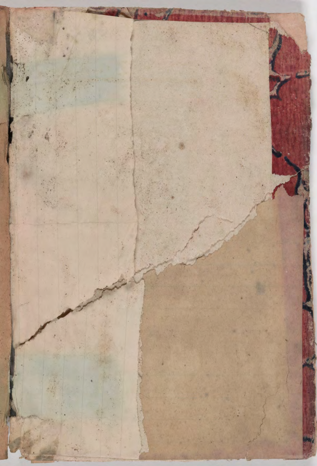
قطعة شظية مرئية من كتاب مجلدّ