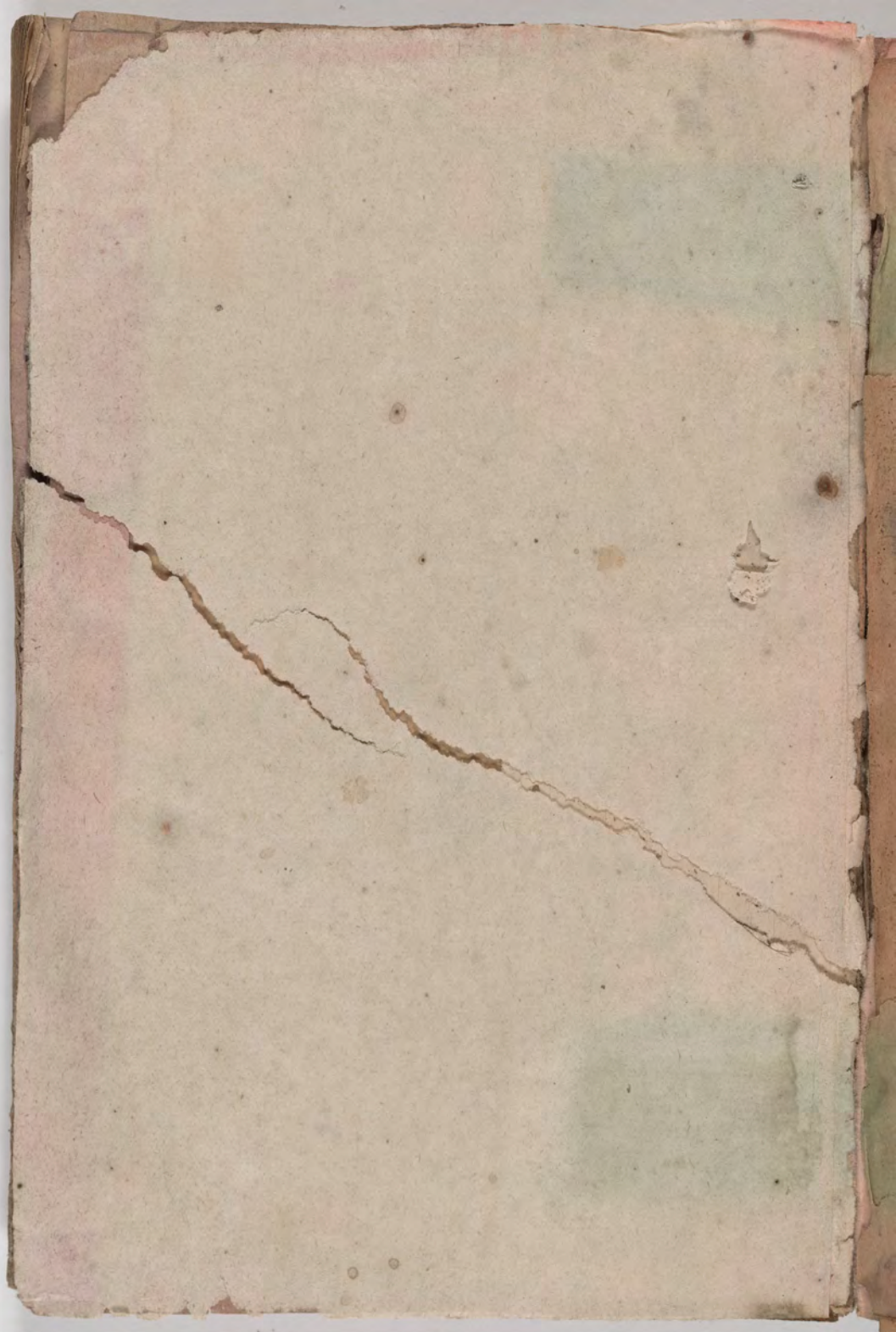
قطعة شظية مرئية من كتاب مجلدّ