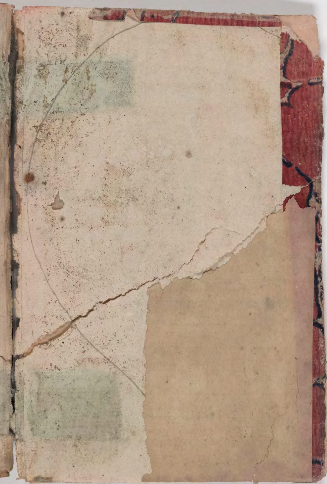
قطعة شظية مرئية من كتاب مجلدّ