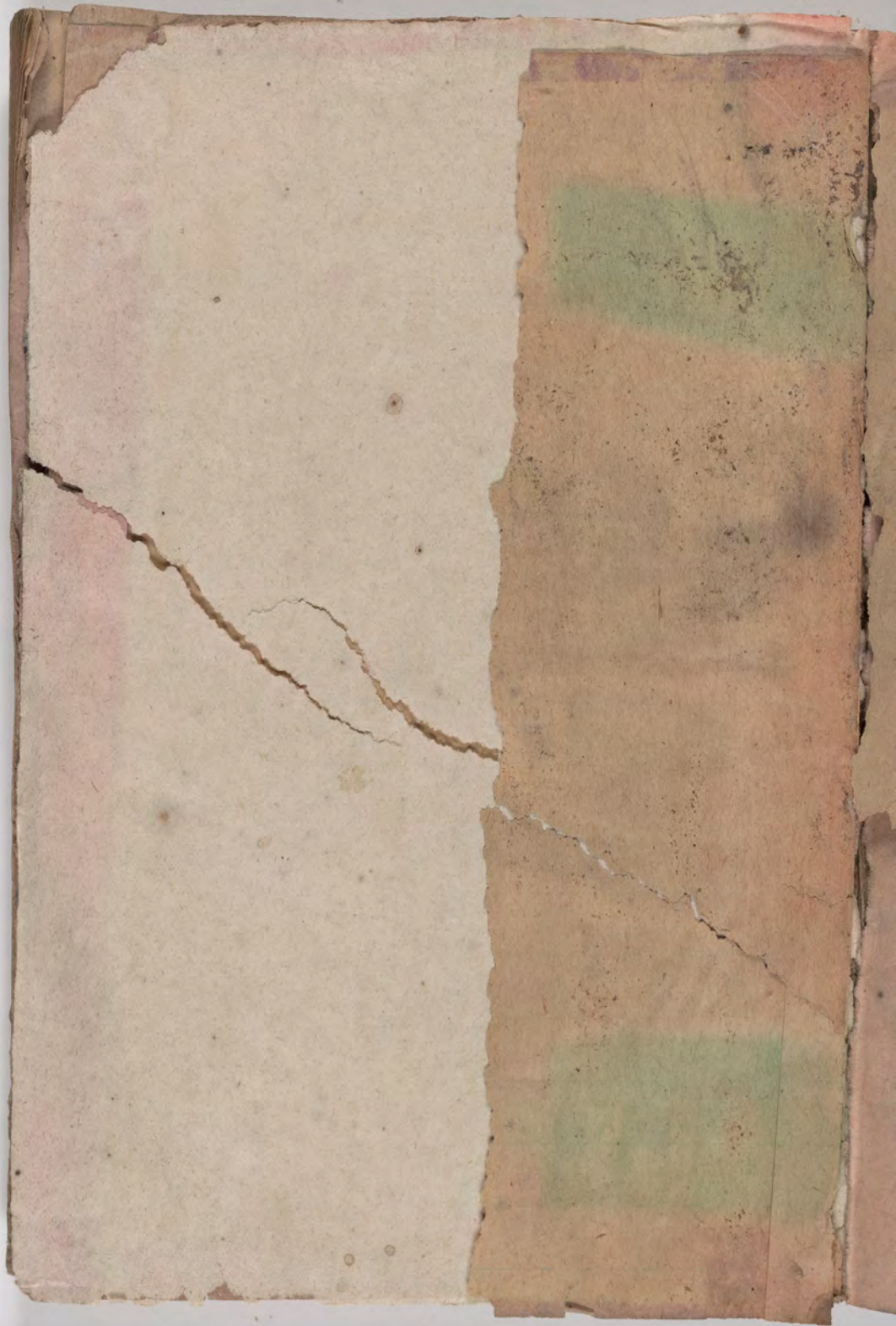
قطعة شظية مرئية من كتاب مجلدًا visible fragment from bookbinding