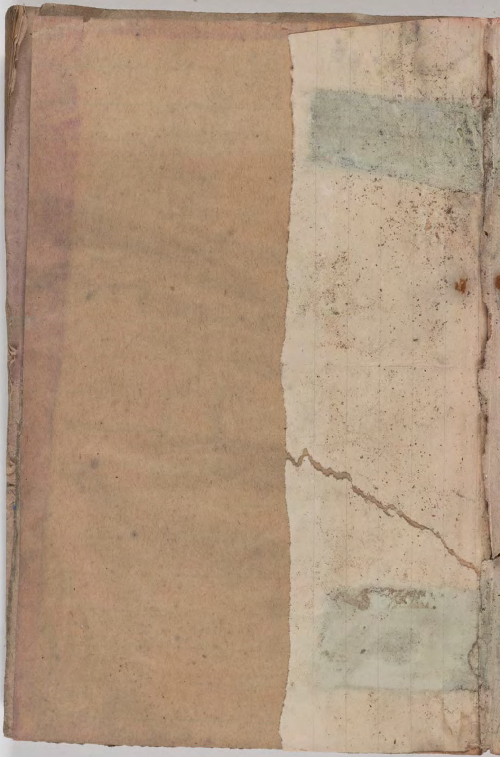
قطعة شظية مرئية من كتاب مجلدّ