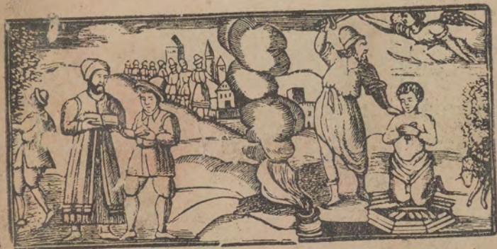
האדו אברהם ויצחק וירדו קאעד יעמל אלעקדא ליצחק * האדו יעקב ועשו

וְאֶלְדִּי לִיסוּ יַעֲרָף לִיסָאֵל אַנְתָּ תִּפְתַּח לוֹ כְּמָא אַנְקָא וּתְלַבֵּר לְאִבְנֶךָ בְּדַאֲלֶךָ אֵל יוֹם לִיִּיקוֹר פִּי סַבֵּב הָאֲדָא צְנַע אֶלְדָּה לִי בְכְרוּנִי מִן מִצְרַיִם יִטִּיק מִן רֵאס אֵל שְׁהוּר תַּעֲלַמְנָא לְנִיקוֹר בְּדַאֲלֶךָ אֵל יוֹם אִי בְּדַלְךָ אֵל יוֹם יִטִּיק מִן קַבֵּל יוֹם תַּעֲלַמְנָא לְנִיקוֹר פִּי סַבֵּב הָאֲדָא פִּי סַבֵּב הָאֲדָא לִם קֵלֶת אָדָּא בְּסַעֲתָ אֵל פְּטִיר וּלְמִרְאָר מוּצוּעִין לְקַדָּאמְךָ :