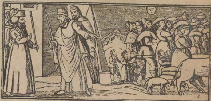
הארו אולאר ישראל וקה ארדי כרגו מן מצריים והארו משה ואהרן ופרעה קאערין יקורו לפרעה אלו ישראל כרגין אלו