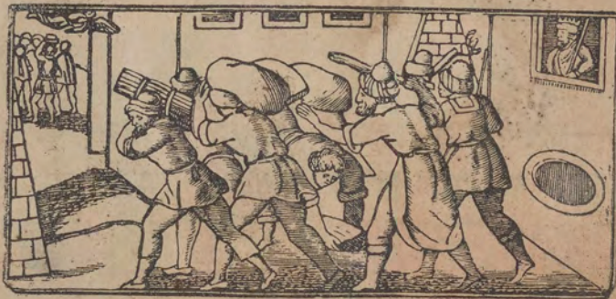
האר אלרייר כודאם מתע פרעה פי מאצר

טרפון * ארדי כאנו מנתבין בבנין ברק * וכאנו יחפון בכרוג מצר טור דאלך אל לילא * אלא אן גו תלאמידרום וקאלו להום * יא סראתנא דנא וקרת קרית שמע מאל אר צבּח :