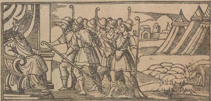
הארו כואתו מתע יוסף וגאהו רפרעה וקארי לי אוחנא נינא גרעאיו פר גנס

יכלי א כוס עלא א מצח ויכשף א שלחן אלא מא יוצל ללפיכך