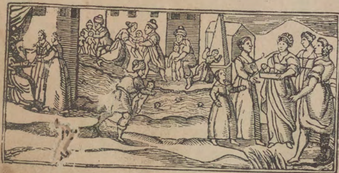
הָאֵדוּ וְקַת אֵדְרִי כְתִיָא כְנַת פְּרַעָה מַסָּאת תַּנְסַל פֶּל וָאֵד וְאֵלְקַת מֹשֶׁה פֶּל וָאֵד וְקַמְתּוּ

כִּי־יָד אֶל שְׂדֵי־דָא הָאֵדָה אֵל וּבָא כְּמָא אֲנָקָא הוֹדָא צְרִבַת אֵלְלָה סַאכְנָא בְטַרְשֶׁךְ אֵדְרִי בַל סַחְרָא בַל כִּיל בַל חֲמִיר בַל גַּמְלִי כַד בָּקָר וּבַל גַּנְס וּבָא תְקִיל כְּתִיר :