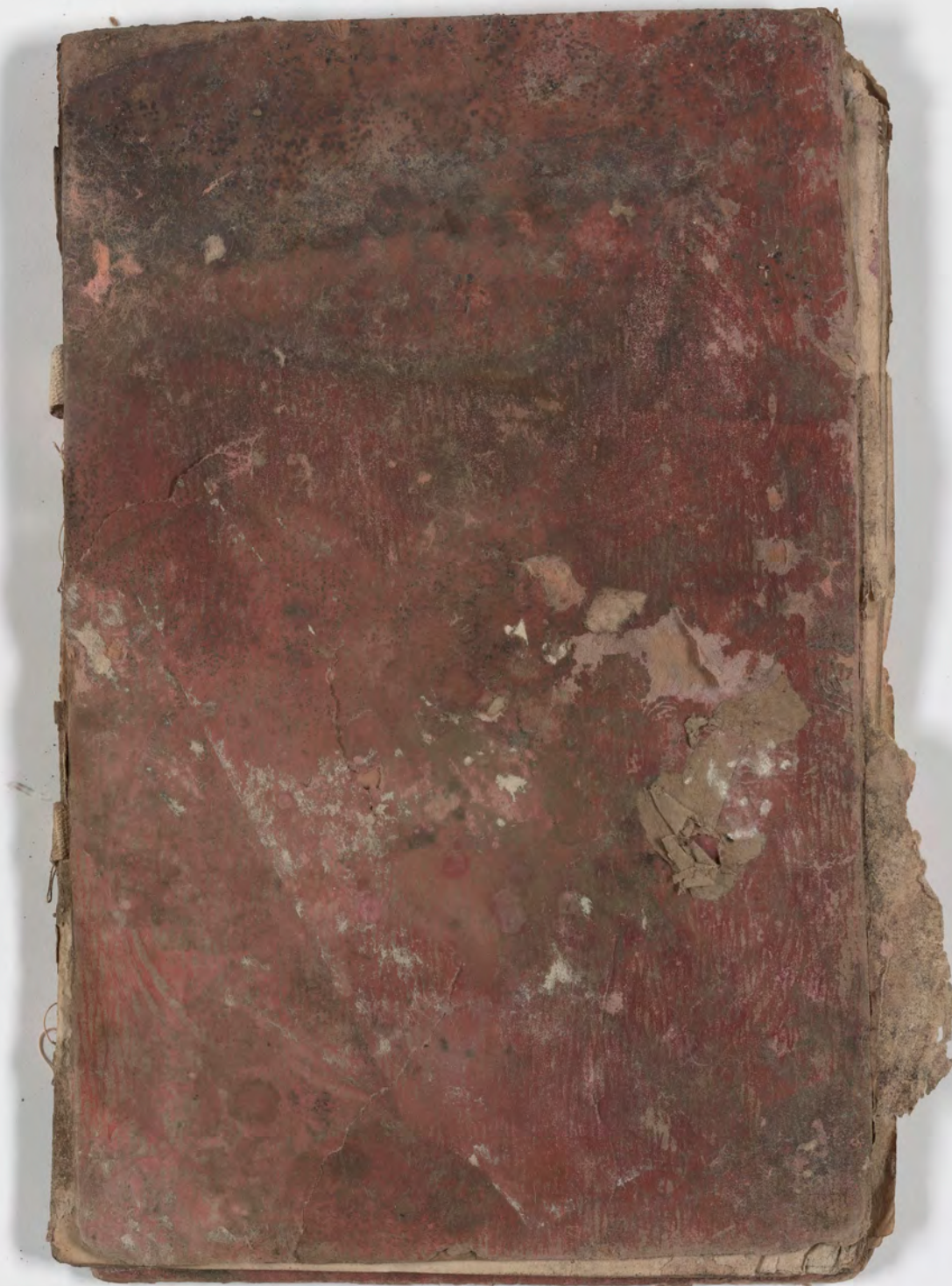
fragment/insert found with book / قطعة شظية / إدراج وجد(ت) مع كتاب