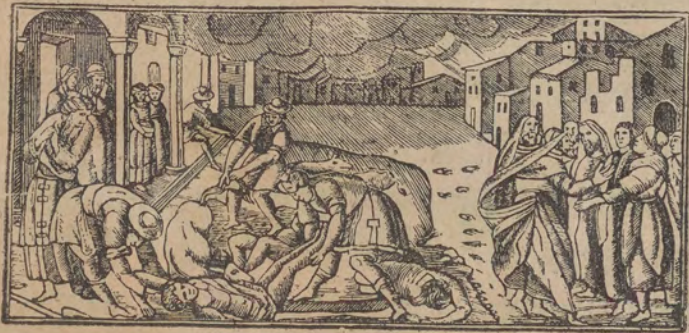
הארי אלמצריים קא עדיין מנבנין והארו ישראל פרחאנין

איש קדר אנצ'רבו בקדרא עשר צרבאת קול מן הל סאע במצר אנצ'רבו עשר צרבאת ועלא אל בחר אנצ'רבו כמסין צרבה :