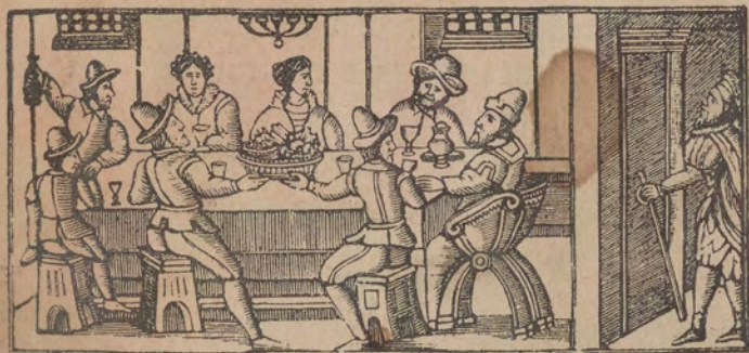
הארז קאערין יקול להגדה ויהולו לכאב רל עני

מה נשתנה הגילה הזה מכל הגילות שבכל הגילות • אין אנו מטבלין אפילו פעם אחת והגילה הזה שתי פעמים :