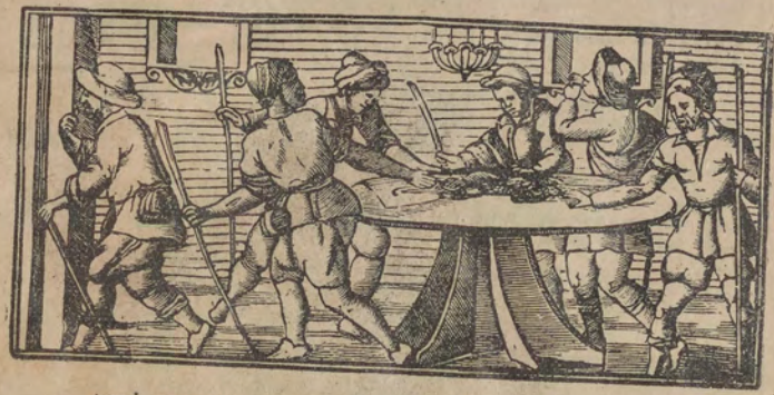
האדו קעדון יאכלו חרבן פסח ואחר סראק כטף להים טרף לחם וארב

תכלם פרעון אך צאלם ליימחי אלא אסמהום וליטפי אלא דברהום מן וצט אך דוניא :