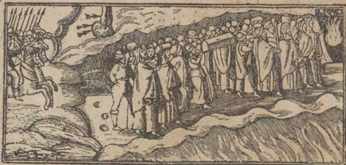
הארו אילאר ישראל וקת אלדי נאזו פל כחר ומשה סק אלכאחר ונאזו ישראל ואלקאו עצם יוסף הצדיק

עינאיב אל טאייק דפרתו ועלא פצלו חפתו הל אן ערפתו אד בכיר הוא אלה : וקולו