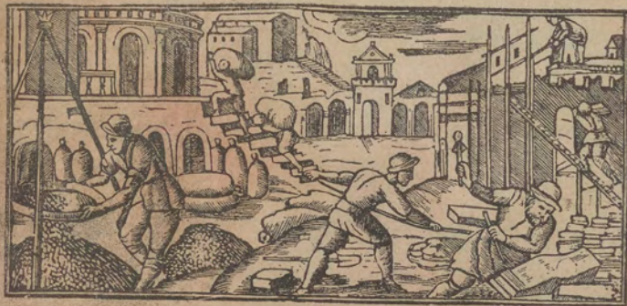
חאדו בלאדארן פיתום ורעמסס ואלכדאסא וארכאנאיא אלרי קאערין יבניו

וְאִסּוּ לָנָא אֵל מְצָרֵינוּ וְעַבְדוּנָא וַיַּעֲלוּ עֲלֵינוּ בְּדַמָּא צַעֲבָא : וְאִסּוּ לָנָא אֵל מְצָרֵינוּ כְּמָא אֲנַקְאֵר תַּעֲאֵלוּ נִתְחַאֲיִיל לוֹ לֹאֵלָא יִבְתֵּר וַיְכּוֹן אֵל תַּצְאֵרְפָּנָא חֲרוּבָה וַיִּנְגְּמַע אֵינְצָא הוּא עֲלָא בְּאַנְצְנִינָא וַיִּתְחַרְבוּן בֵּינָא וַיַּצְעֻדוּנָא מִן אֵל כֵּלֵד :