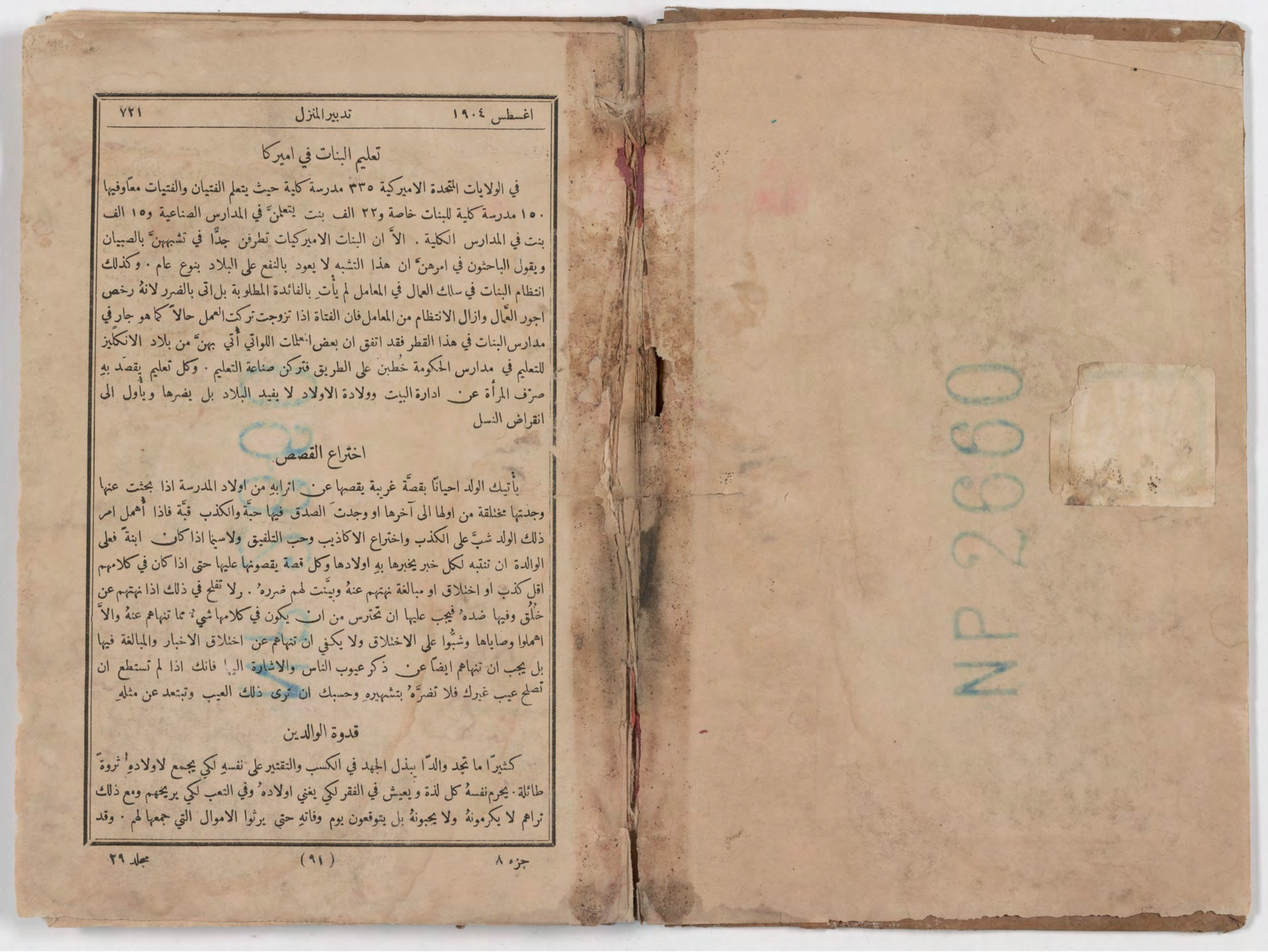
قطعة شظية / إدراج وجد(ت) مع كتاب fragment/insert found with book