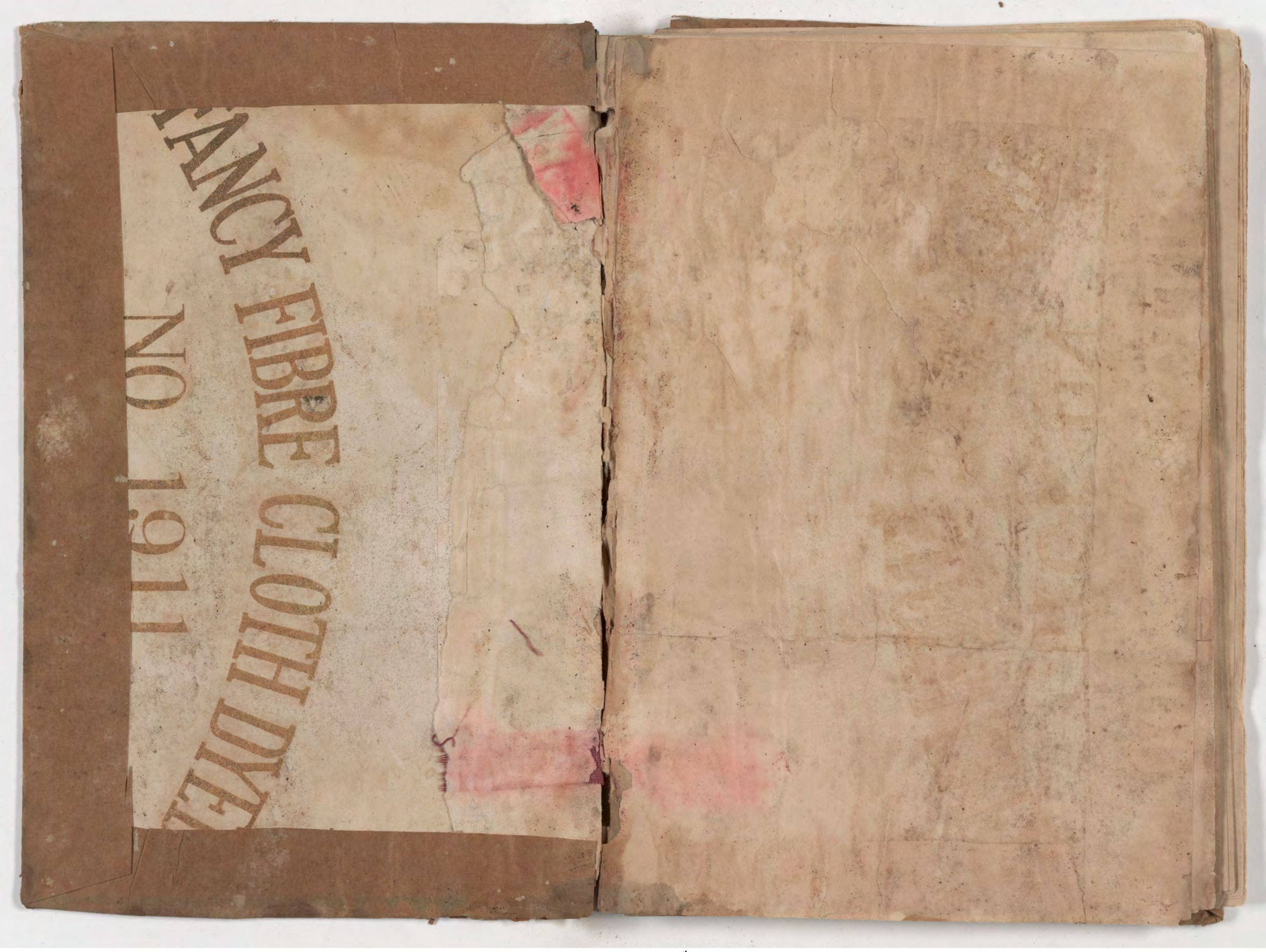
visible fragment from bookbinding قطعة شظية مرئية من كتاب مجلد والماء