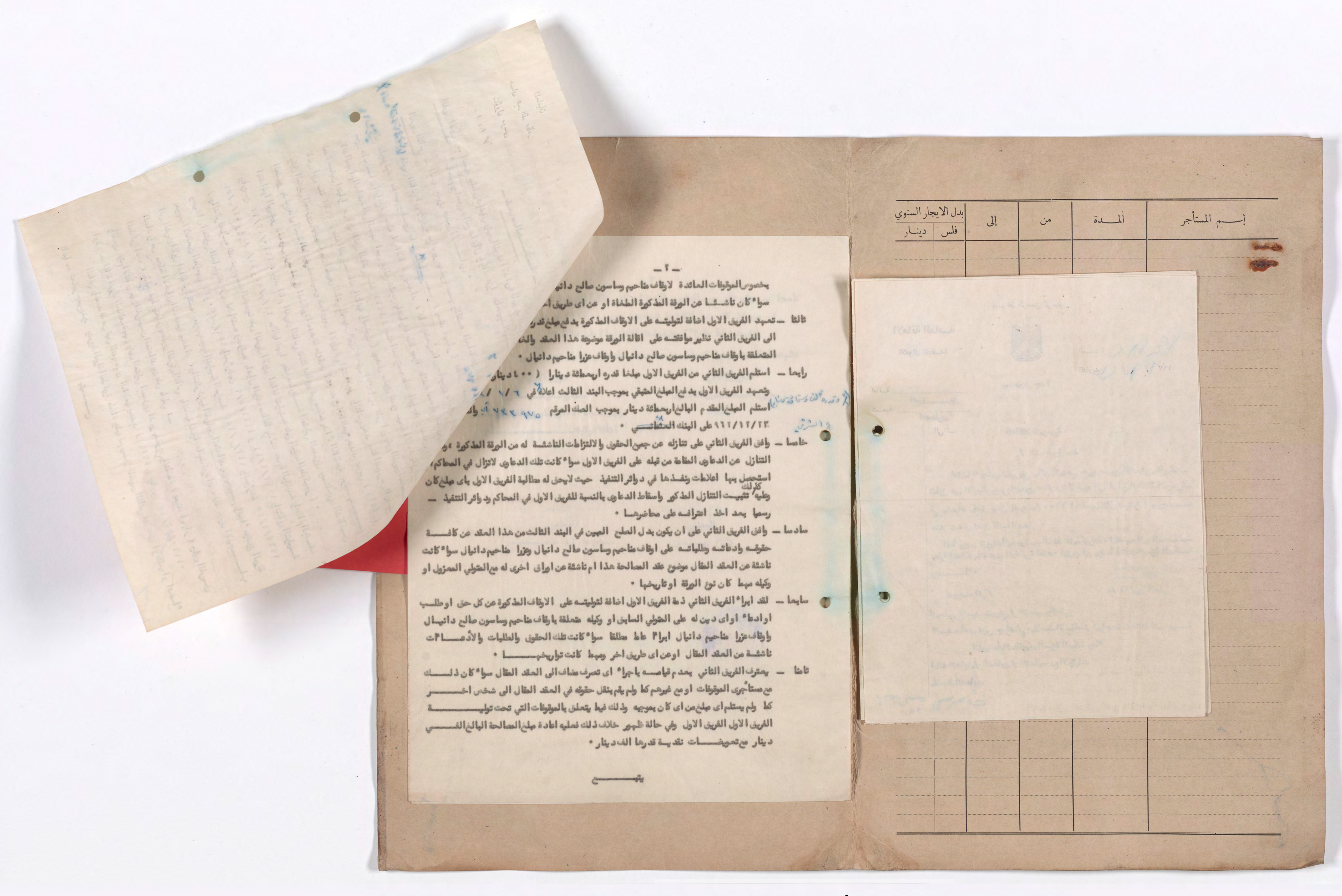
pages cannot be separated for imaging صفحات لا يمكن فصلها من أجل تصويرها