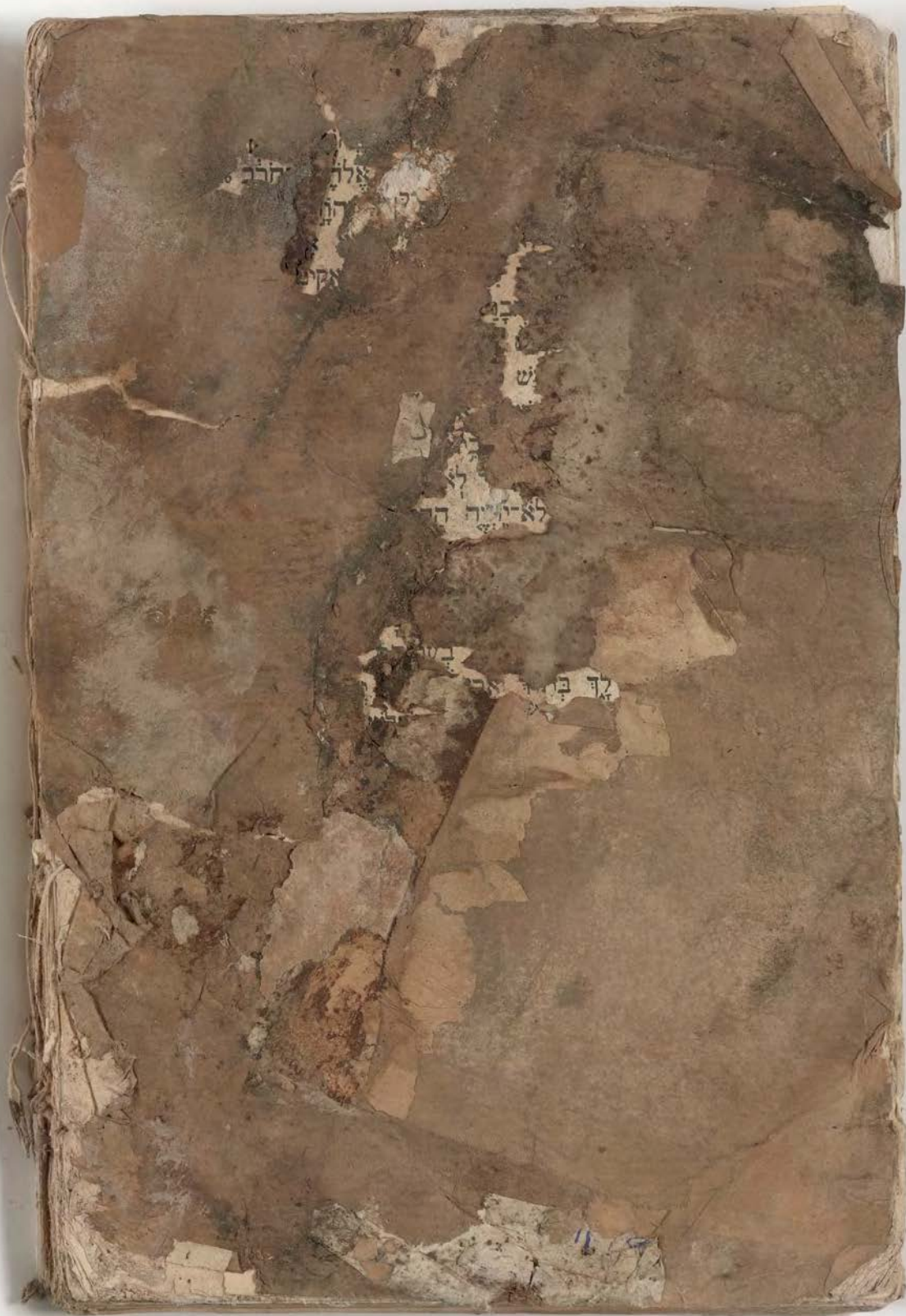
لا يمكن فصلها من أجل تصويرها pages cannot be separated for imaging