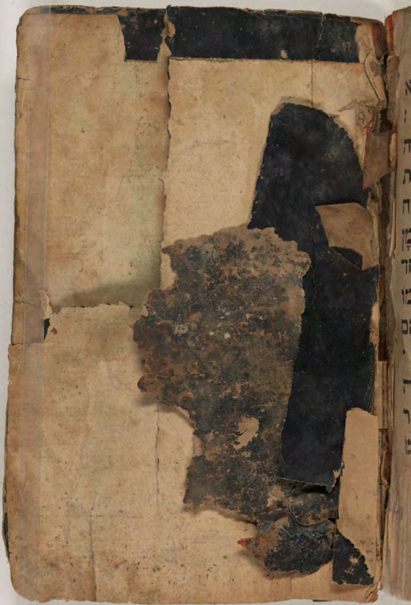
قطعة شظية مرئية من كتاب مجلدّ