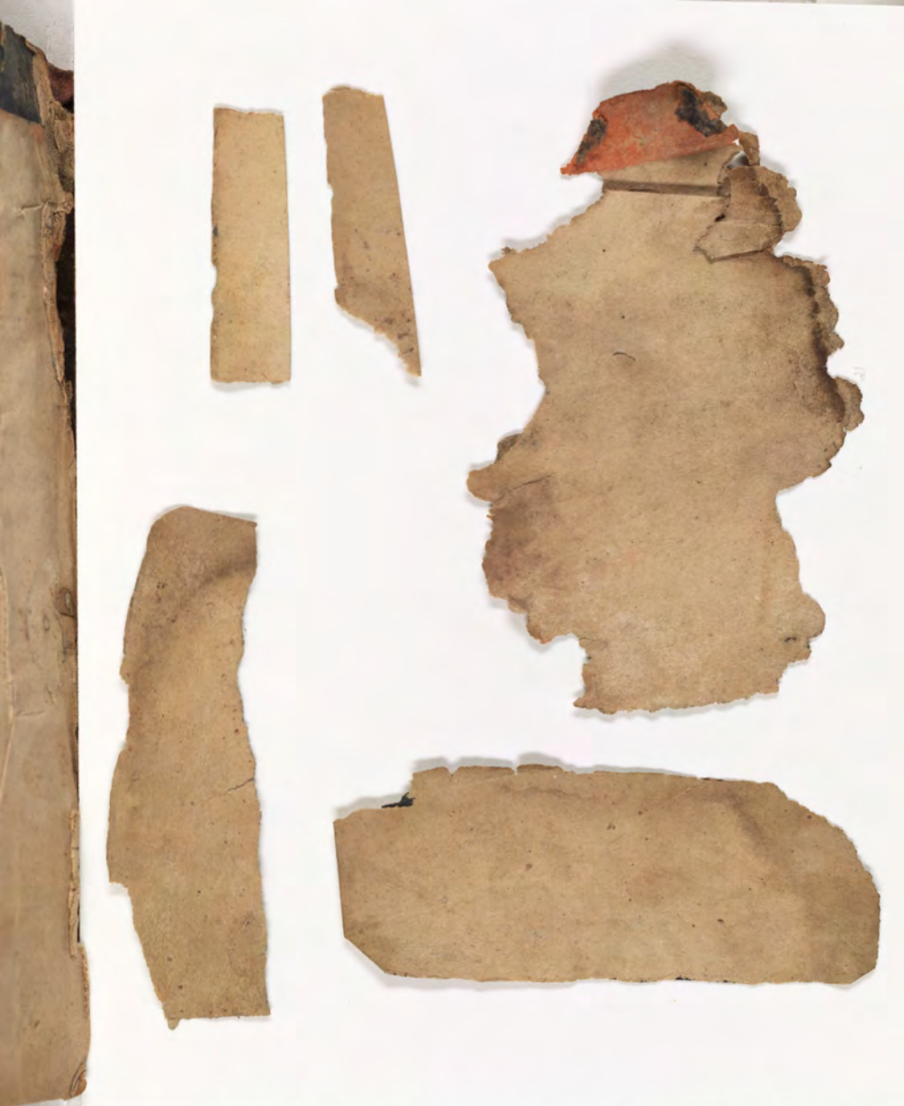
قطعة شظية / إدراج وجد(ت) مع كتاب fragment/insert found with book