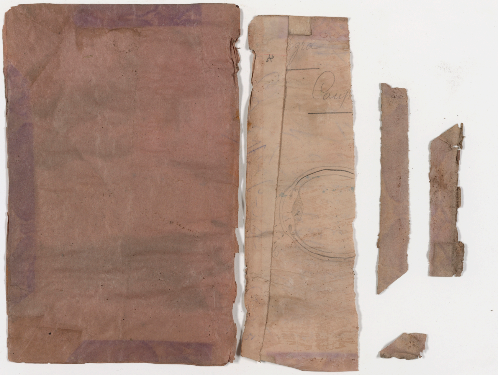
visible fragment from bookbinding