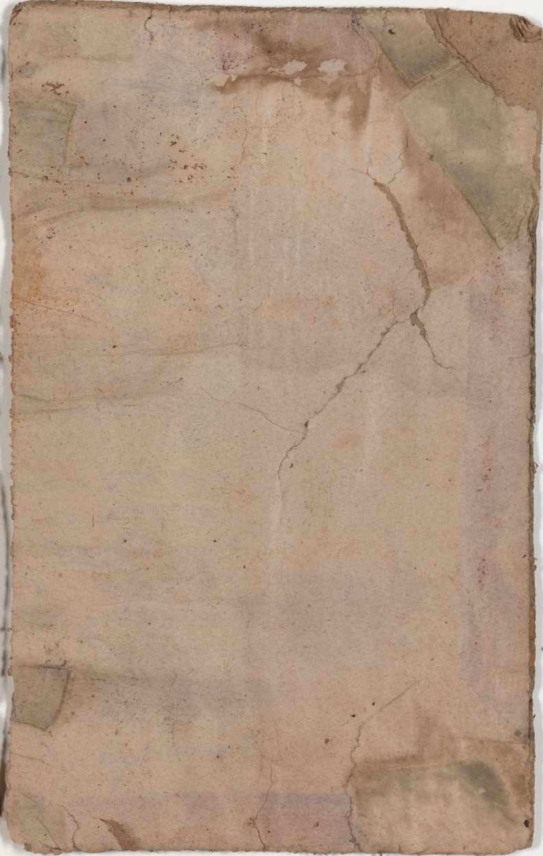
visible fragment from bookbinding