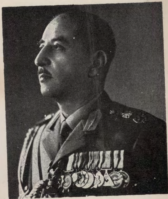
المهيب السيد احمد حسن البكر رئيس الجمهورية العراقية والقائد العام للقوات المسلحة