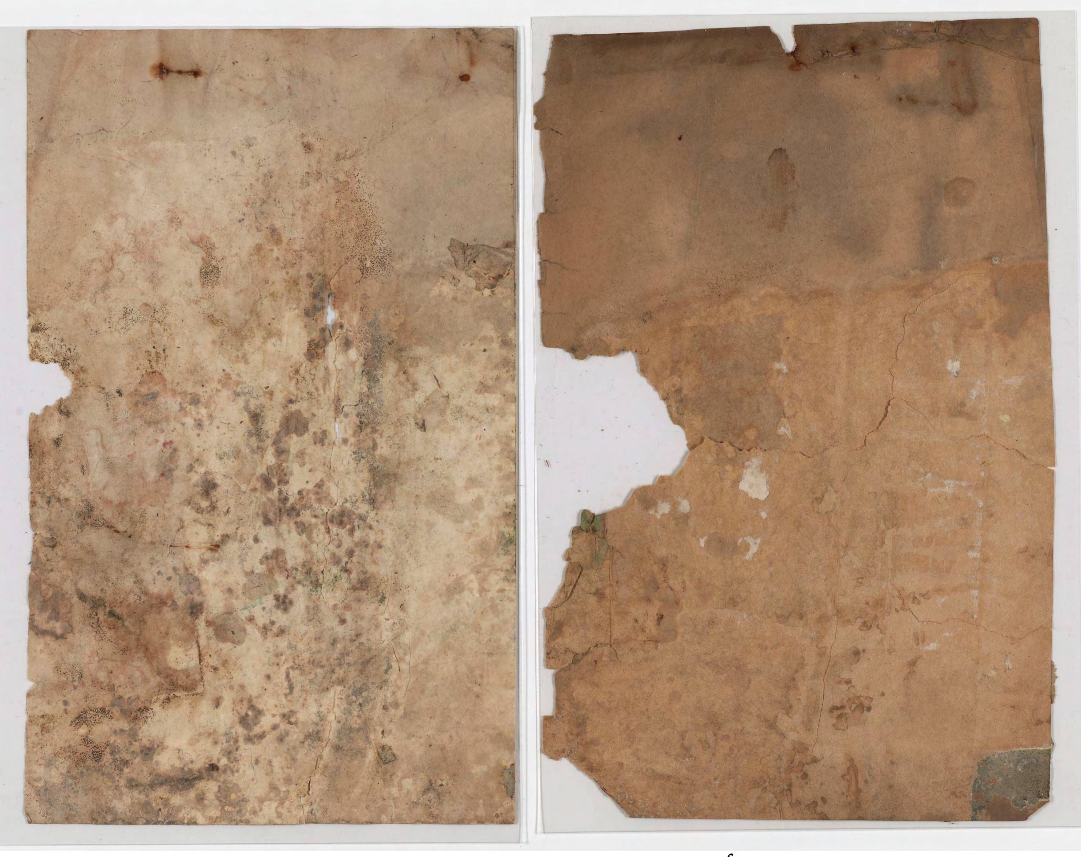
pages cannot be separated for imaging صفحات لا يمكن فصلها من أجل تصويرها