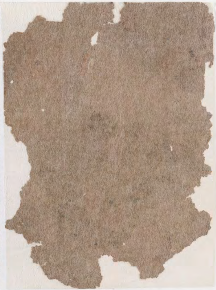
صفحات لا يمكن فصلها من أجل تصويرها pages cannot be separated for imaging