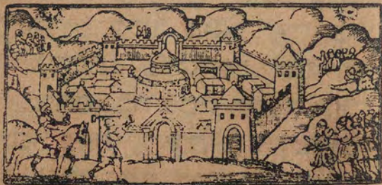
ובנה לנו את בית הבחירה

עלא ואחרא כם וכס גיירא מטוייא ומטוייא לך כאלק עלינא • כרגנא מן מצר • צנע ביהום חקאמא • צנע כמעבודא תהום • קתל בכורהום • עטא לנא אלא מאלהום • שק לנא אלא אר בחר • עברנא פי וצטו בד יבם • גרק עדאנא פי וצטו • בפא עוואיינא כל בר ארבעין סנא • טעמנא אלא אל מן • עטא לנא אלא אל סבת • קרבנא קדאם גבל סיני • עטא לנא אלא אל תורה • דכנא לי בדר יסראיל • ובנא לנא אלי בית אל מכתר לייגפר עלא גמיע דנוכנא :