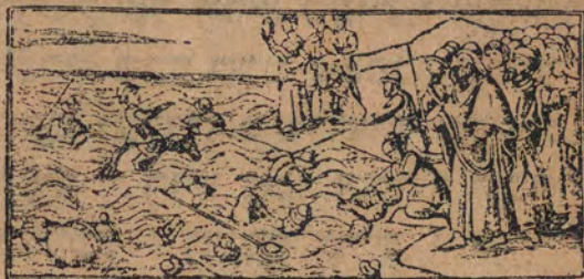
וער הים לקו מאתים וחמשים מכות

רבי עקיבא יקול מגין אד כל צרבא וצרבא אלדי גאב י מקדס תבארך הוא עלא אל מצריין במצר באנת מאל כמס צרבאת כמא אנקאר ירסל ביהום שריית נצבו חמייה וצכט וציקרה מרסלת מלאיבת אל רדיין שריית נצבו ואחדה חמייה תנתין וצכט תלאתה וציקה ארבעה מרסלת מרלאיבת אל רדיין כמסא קול מן הסאע פי מצר אנצרכו כמסין צרבא ועלא י בחר אנצרכו מאייתן וכמסין צרבא :