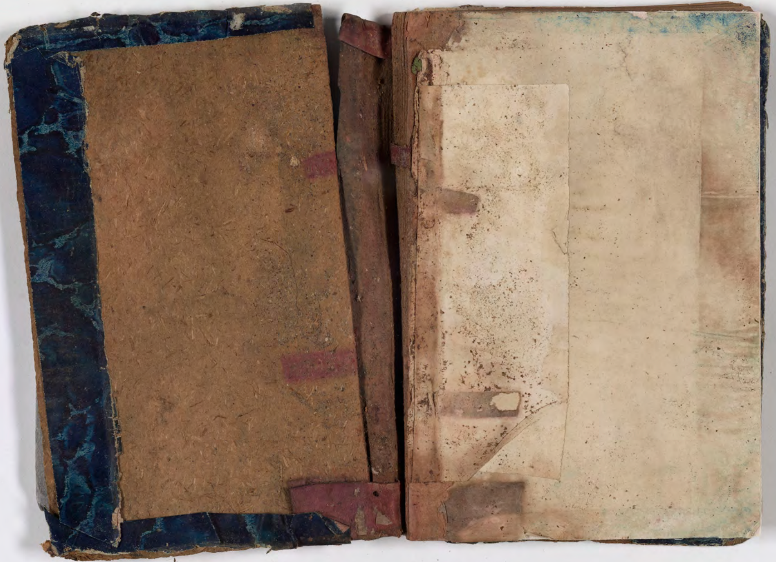
قطعة شظية مرئية من كتاب مجلدّ visible fragment from bookbinding