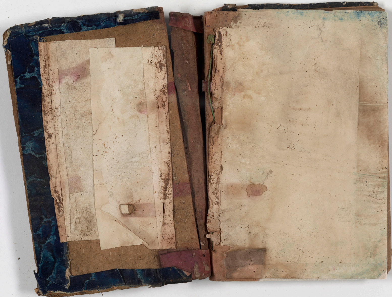
قطعة شظية مرئية من كتاب مجلدّ visible fragment from bookbinding