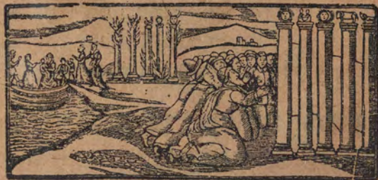
ויעברו אלהים אחרים

יהושע אלא גמיע אל קום • האבדא קאל אללה אלאה ישראל פי עבר אל נהר גלסו אבהא תבוס מן קדים תרח אבו אברהים נאבו נחור ועברו עבאדא אנגבייה :