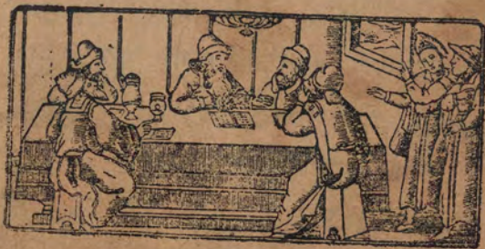
שתוי מסבין בכני ברק

חכאיה סארת • ברבי אלעזר • ורבי יהושע • ורבי אלעזר אבן עזריה • ורבי עקיבא • ורבי טרפון • אדרי פאנו מנתקין בבני ברק • ופאנו יחבון בכרוג מצר טור דאלף אר ליקא • אלא אן גו תלאמירחום וקאלו להום • יא סדא תנא דנא וקת קרית שמע מאר אל צבח :