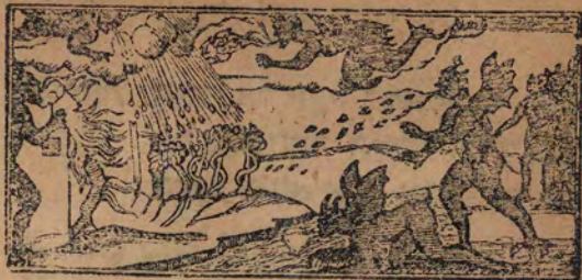
דם ואש ותמרת עשן

דָּבָר אַחֵר • בִּיד הַזֹּקֵה שְׁתִּים • וּבִזְרוּעַ נְטוּיָה שְׁתִּים • וּבְמוֹרָא גְדוֹל שְׁתִּים • וּבְאוֹתוֹת שְׁתִּים • וּבְמוֹפְתִים שְׁתִּים :