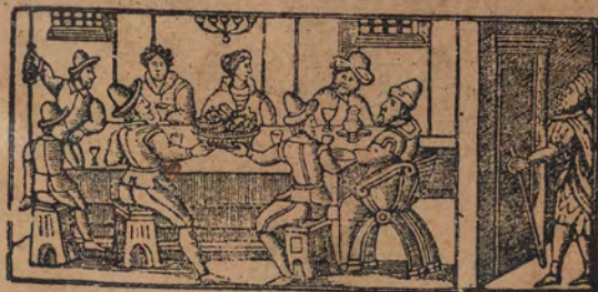
כל דכפין יתי ויכול

יְיָ וַיֹּאכַל כָּל מַעֲתָאזוּ יְיָ וַיִּפְסַח הַדָּר סְנֵי נַחֲנָא הוּן • סְנֵת אֵל גְּאִיָּא פִי כְלָד יִסְרָאֵל הַל סְנָא נַחֲנָא הִין עֵבִיד • סְנֵת אֵל גְּאִיָּרָה פִי כְלָד יִסְרָאֵל בְּנִין אֵל מְטְרוּקִין :