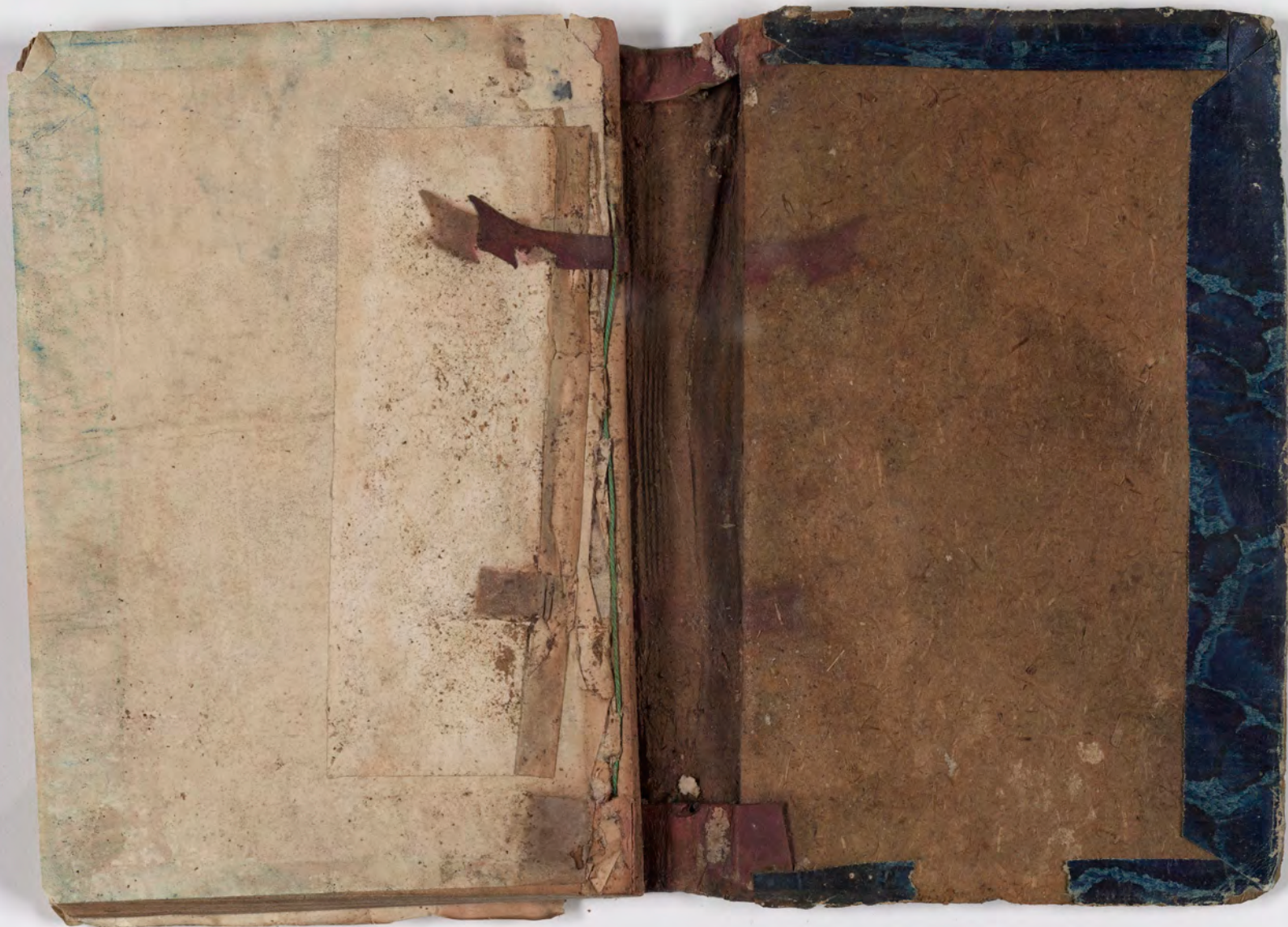
قطعة شظية مرئية من كتاب مجلدّ visible fragment from bookbinding