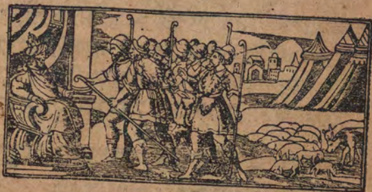
ויואמר אל פרעה לומר בארץ כאנו

וַתַּחַדֵּר לַמִּצֵּר מַגְצוּב עֲלֵא קוֹל אֵל פְּסוּק • וּסְכַן תָּם תַּעֲמִמְנָה אֵד לִם נֹזֵר לִיתְרַצֶּךָ אֵלֵא לִיסְכַן תָּם • כִּמָּא אַנְקֵאֵל וּקְאֵלוּ אֵלֵא פִרְעוֹן לִנְסַכְן פִּי אֵל בְּלֵד גִּינָא אֵד לִים מִרְעָה לֵד גַּנִּם אֵדְרִי לַעֲבֹדֶיךָ • אֵד תְּקִיד אֵל גּוֹעַ פִּי בְלֵד כְּנָעַן וְהֵל סֵאֵע יִגְלִסוּן אֵל אֵן עֲבֹדֶיךָ פִּי בְלֵד אֵל סְדִיר :