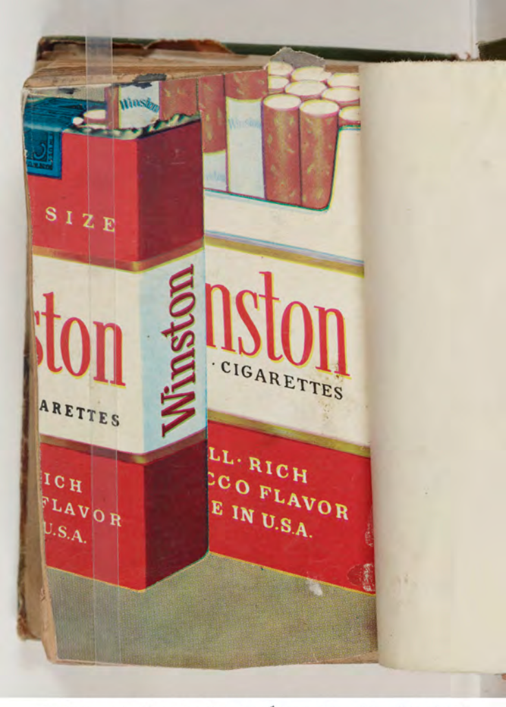
قطعة شظية مرئية من كتاب مجلدٌ visible fragment from bookbinding