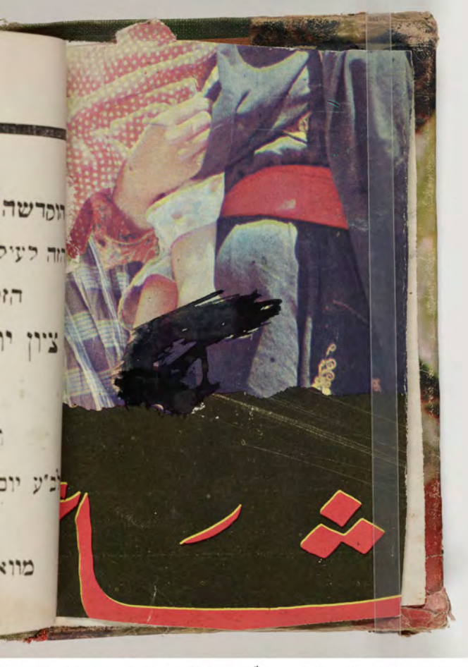
visible fragment from bookbinding قطعة شظية مرئية من كتاب مجلدٌ