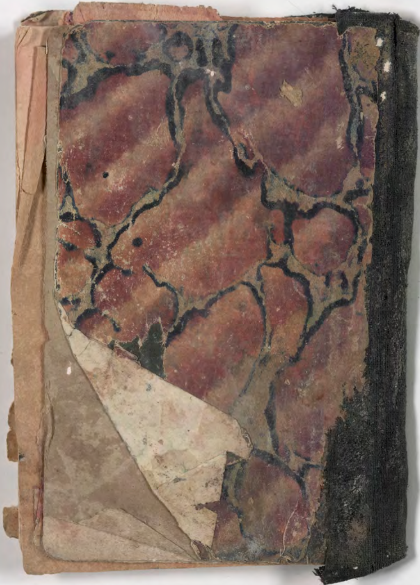
قطعة شظية مرئية من كتاب مجلدّ